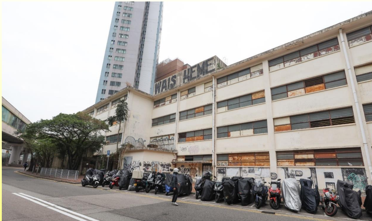
正立面（面向美環街） Front elevation (facing Mei Wan Street)

Mayar Silk Mills, Nos. 13-19 Mei Wan Street, Tsuen Wan, New Territories