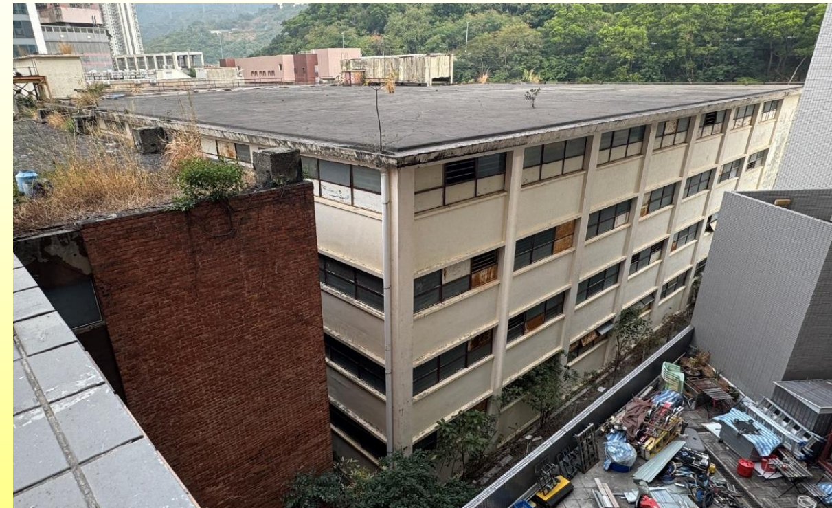
東側立面 East side elevation